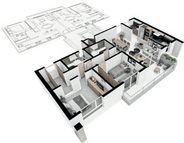
Planta unidad 3 ambientes - 103m 2