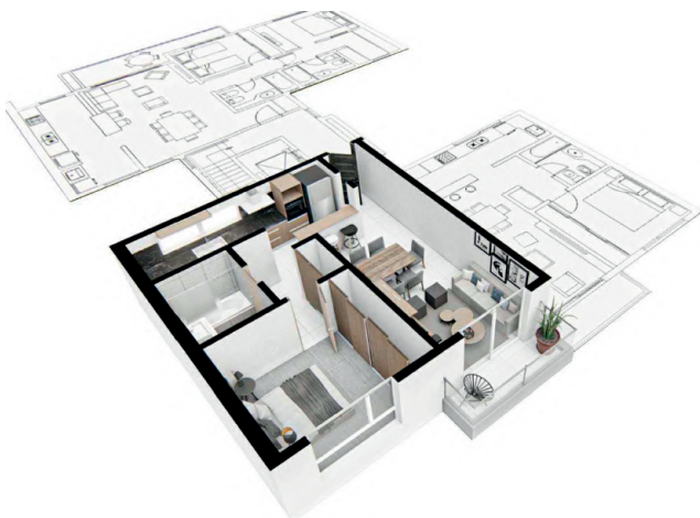
Planta unidad 2 ambientes - 57m 2